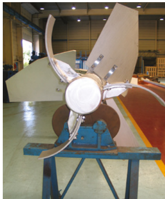
Специальное оборудование для специальных изделий