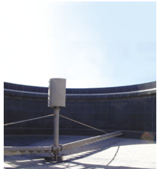
Лопатка из супердуплексной нержавеющей стали Фосфорная кислота