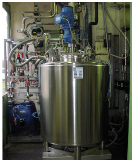
Полный пакет для тонких химикатов