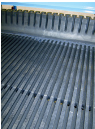
Förderband aus Naturkautschuk